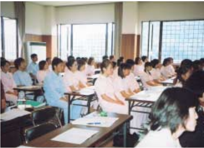
平成13年度 実習出発式

第一段階の実習は特養であり、施設の日課にそって基本的な援助技術方法のみならず、通所サービス、リ