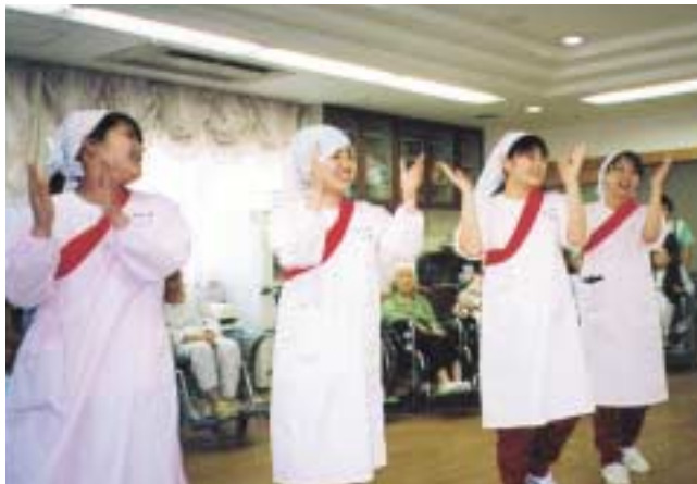
楽しいレクリエーションリハビリ

施設の中で、不自由な体を一生懸命動かしながら、「これをしておかないと」とりハビリに励んでおられる高齢者の姿を見て、私たちも「今、そしてこれから」を真剣に考えることを教えられました。高齢者に少しでも生きることの喜びや楽しみ、そして安心感を提供したいと思えました。人が好きになった実習でした。