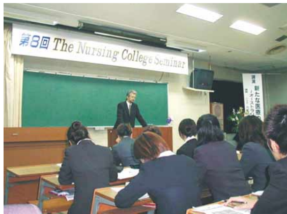
講演：オーストラリアの医療

当日は、ニック先生が遅れて来られるというハプニングがありました。が、無事に会を始める事が出来ました。講演の内容は、オーストラリアの医療の現状などについてのお話でした。オーストラリアでも高齢化が問題になっているそうです。また、入院日数を減らし在宅看護を増やしていくという動きが強いそうです。